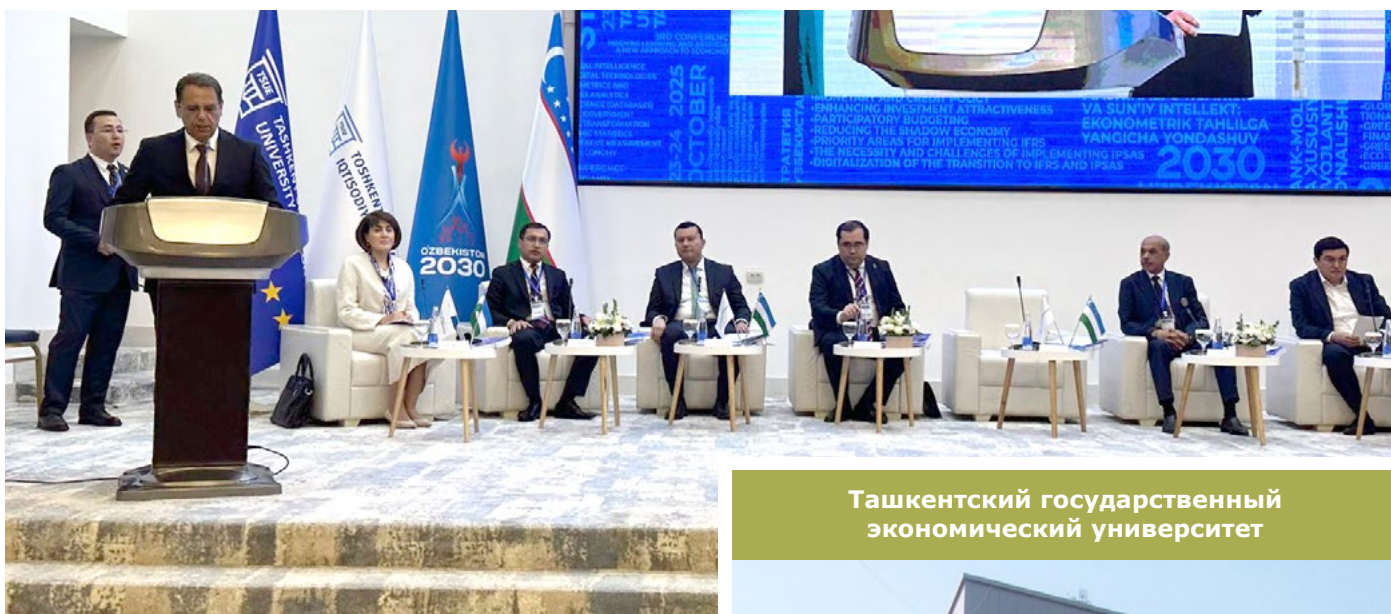
Ташкентский государственный экономический университет

С 23 по 24 октября на площадке Ташкентского государственного экономического университета (ТГЭУ) состоялись мероприятия Международного форума «IV глобальные и национальные экономические тенденции: стратегия «Узбекистан – 2030». В масштабном форуме приняла участие делегация Уральского государственного экономического университета.